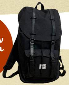
Mevrouw Van Veen WISKUNDE

Wat is het leukste in uw tas? "Het spelletje 30 Seconds met daarop de wiskundige begrippen. Dit spel speel ik af en toe met een klas als we aan het einde van de les of van een hoofdstuk nog wat tijd over hebben." Wat kan er niet ontbreken in uw tas? "Mijn agenda." Waar heeft u deze tas gekocht? "Bij Pasveer in Meppel."