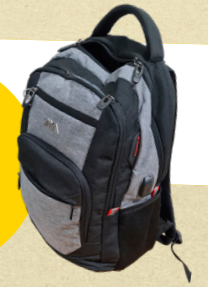
Meneer Wind TECHNIEK

Wat heeft u elke dag mee in de tas en waarom? "Drie brillen, een muziek box en een regenpak." "Vier zelfs, want er staat er ook nog één op mijn neus. De bril voor veraf heb ik meestal op. Maar wanneer ik in de klas de leerlingen én de werkstukken wil kunnen zien, zet ik mijn "variafocus-bril" op. Daarmee kan ik veraf en dichtbij goed zien. Maar als ik die de hele dag op houd, krijg ik daar weer hoofdpijn van. Verder heb ik een leesbril bij me voor als ik veel moet lezen. En de vierde is een zonnebril op sterkte, die draag ik op de scooter wanneer de zon laagstaat." Waar heeft u deze tas gekocht? "Op Amazon." Wat is het meest bijzondere aan uw tas? "Er zit een oplaadmogelijkheid aan de tas, waar je een telefoon aan kunt opladen."