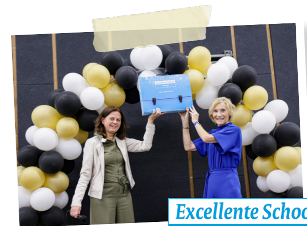
Excellente School 2021/2022 - 2024/2025 VMBO-G/T